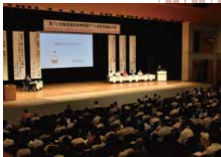
▲各県代表による研究協議