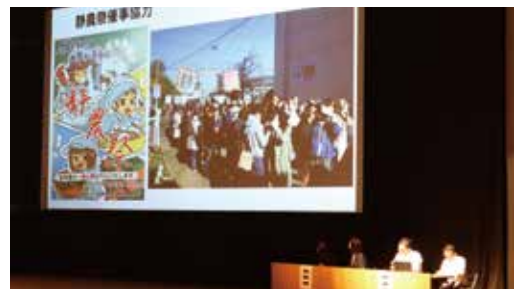
▲研究協議（静岡県立静岡農業高校）

武義高校は、学校名の由来から始まり、保護者大学見学会、学校祭緑日、PTA就職面接指導、挨拶運動・交通安全指導など、コロナ禍で制限されましたが工夫してPTA活動をされたことが紹介されました。このようにPTA役員として前向きに学校と関わることで一