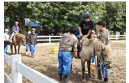
▲あぐりキッズスクール（乗馬）

目指した青パパイヤ栽培の研究を継続しています。生物科では1年生の1年間は全員が祥雲寮に入寮し、文字通り「同じ釜の飯を食べて」農業の基礎・基本を学んでいます。