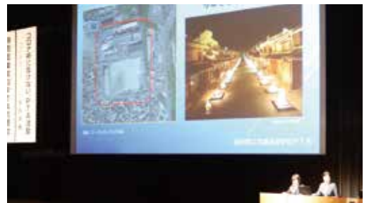
▲研究協議（岐阜県立武義高校）

その後、研究協議を行い、岐阜県立武義高校PTAが『コロナ禍に負けない、PTA活動』、静岡県立静岡農業高校PTAが『静岡農業高校PTAの活動』というそれぞれのテーマで発表を行いました。