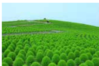
国営ひたち海浜公園