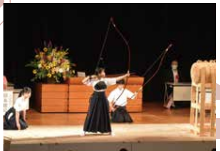
▲大会の成功を予祝する「巻藁射礼」