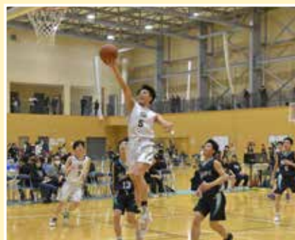
仙南総体 バスケットボール