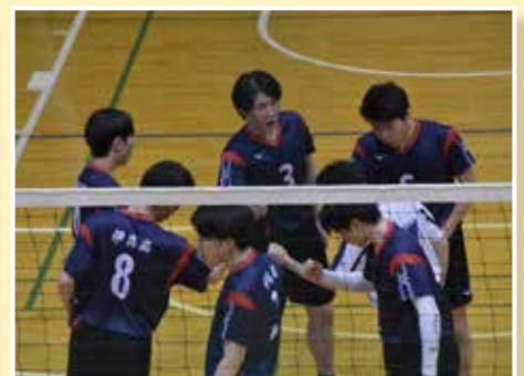
仙南総体 バレーボール