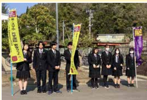
マナーアップ運動